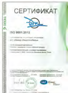
Сертификат соответствия требованиям ISO 9001:2015 «Разработка, производство и продажи кабельной продукции»