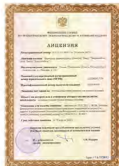
Лицензия на право изготовления оборудования для атомных станций