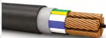
Кабели силовые на номинальное напряжение до 3 кВ