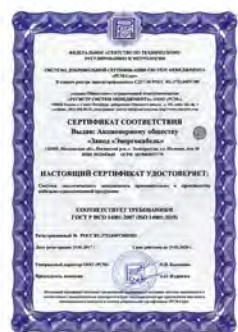
Сертификат соответствия системы экологического менеджмента требованиям ГОСТ Р ISO 14001-2007 (ISO 14001:2015)