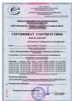
Сертификат соответствия ГОСТ ISO 9001-2015 и ГОСТ РВ 0015-002-2012 в системе Военный регистр