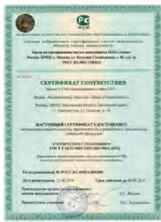
Сертификат соответствия СМК ГОСТ Р ISO 9001-2015 (Система менеджмента качества)