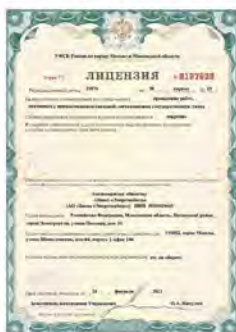
Лицензия на проведение работ, связанных с использованием сведений, составляющих государственную тайну.