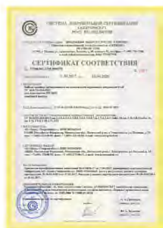
Сертификат соответствия ГАЗПРОМСЕРТ (всего 33 сертификата на всю выпускаемую продукцию)