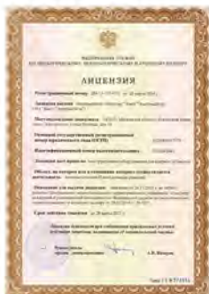
Лицензия на право конструирования оборудования для ядерных установок